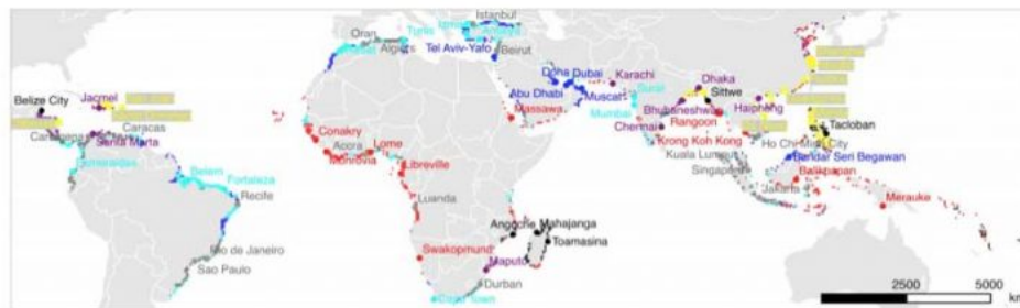
Figura 2 – Aree e città costiere nei paesi in via di sviluppo secondo sette profili naturali, economici o di governo

i cicloni tropicali con crescenti rischi per gli abitanti, danneggiamento di abitazioni e infrastrutture, rilevanti danni alla produzione. Nella Figura 2 sono esemplificati alcuni “modelli” di vulnerabilità nelle fasce costiere in funzione dell’evoltersi di fattori naturali e della capacità adattativa delle città e delle popolazioni. Il modello contrassegnato in giallo – coste della Cina, del Vietnam, golfo del Bengala; Caraibi e Golfo del Messico – è quello che identifica sicuramente le aree costiere più a rischio del globo, oggi, e ancor più domani. Non ci distraggano questi nomi esotici, e non dimentichiamo l’Italia, che ha lunghe e basse coste, delicate e vulnerabili, come ci ricordano – tra altre catastrofi – l’acqua alta di Venezia e i nubifragi di Genova.