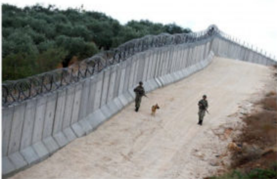
Figura 2: Un tratto di muro alla frontiera tra Turchia e Siria

pochi intralci dai foreign fighters oltreché dai profughi - sta blindando la frontiera con la Siria che è lunga oltre 800 chilometri. Ha chiuso 17 dei 19 varchi di frontiera, ed ha iniziato a costruire un muro di cemento alto tre metri sormontato da filo spinato lungo di essa (Figura 2). Più di un terzo del muro è stato costruito, e si ritiene che l'intera opera sarà completata prima della fine del 2017, rendendo il confine intransitabile. Nel 2016, ha reso noto un'agenzia Turca, oltre 57.000 tentativi di passaggio illegale sono stati contrastati.