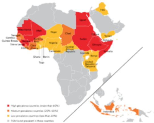
Fonte: DHS and MICS, 2002-2014 data in UNFPA, Demographic Perspectives on Female Genital Mutilation 2015.

L'Italia è anche l'unico paese in Europa per il quale sono disponibili stime dirette del fenomeno ottenute grazie a un'indagine campionaria effettuata nell'ambito del progetto Daphne MGF-Prev coordinato dall'Università di Milano-Bicocca.